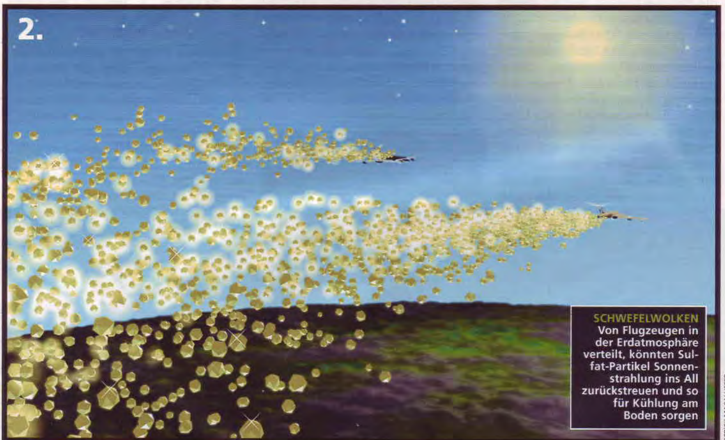
SCHWEFELWOLKEN Von Flugzeugen in der Erdatmosphäre verteilt, könnten Sulfat-Partikel Sonnenstrahlung ins All zurückstreuen und so für Kühlung am Boden sorgen

Bislang ist allerdings unklar, welche Folgen die Partikelfracht auf die Ozonschicht hätte. In welchem Maße nimmt der saure Regen zu? Wie wirken sich die Schwefelpartikel auf die menschliche Gesundheit, vor allem die Atemwege, aus? Solange noch viele Fragen offen sind, müsse die Senkung der Kohlendioxid-Emissionen auch weiterhin Priorität haben, betont Crutzen. Doch es sei angesichts der verschärften Klimalage zu gefährlich, seinen »Plan B« nicht in Betracht zu ziehen. Der in Sachen Geoengineering ebenfalls umtriebige Lowell Wood vom Lawrence Livermore National Laboratory in Kalifornien attestiert der Schwefeltherapie zudem: »Unter all den Vorschlägen, die ich kenne, erscheint sie mir die ökonomischste Lösung, die zudem rasch umgesetzt werden könnte.«