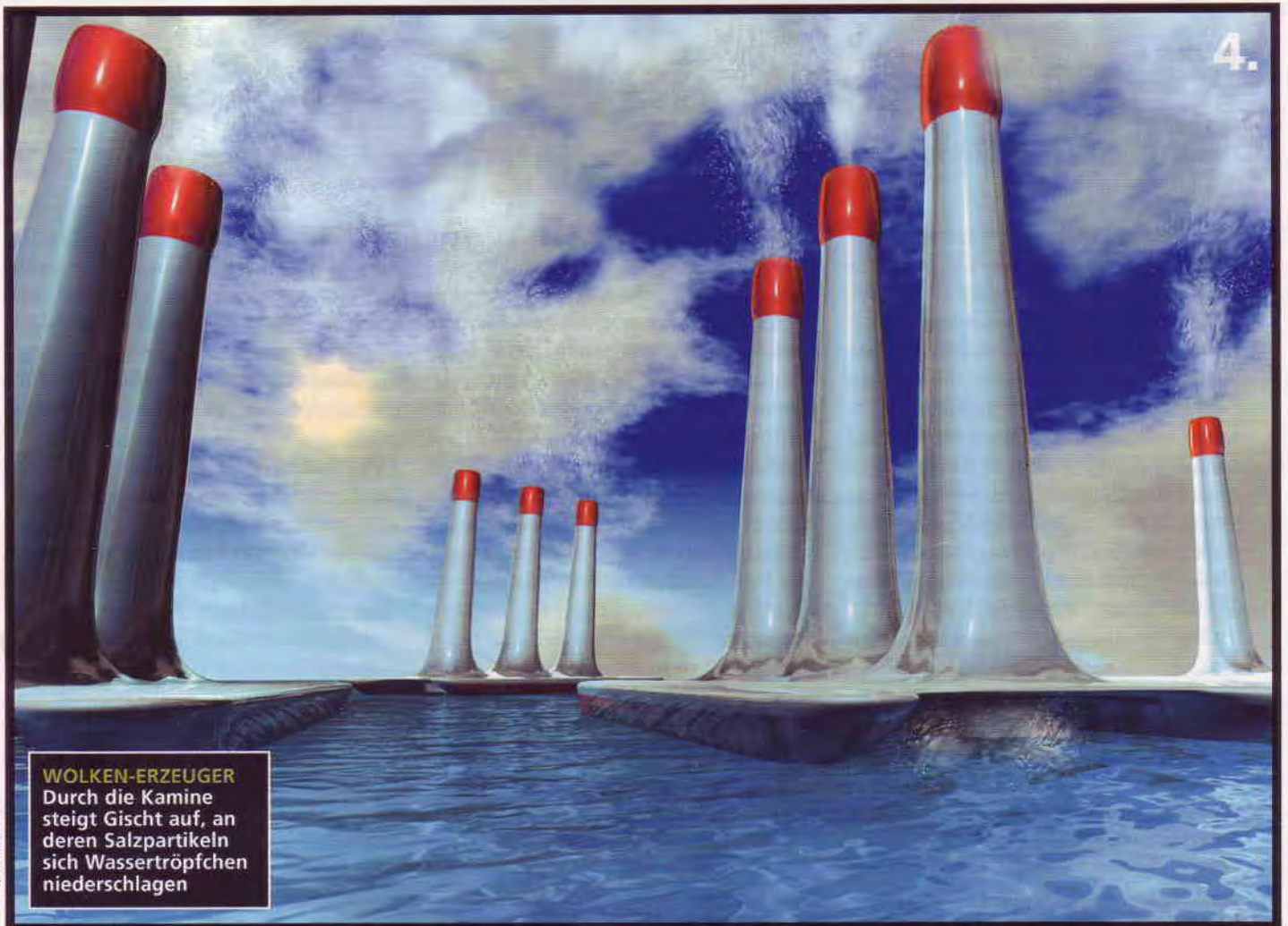
WOLKEN-ERZEUGER Durch die Kamine steigt Gischt auf, an deren Salzpartikeln sich Wassertröpfchen niederschlagen